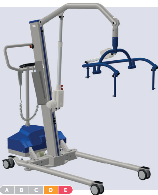
GentleMOVE touch&move 3.1